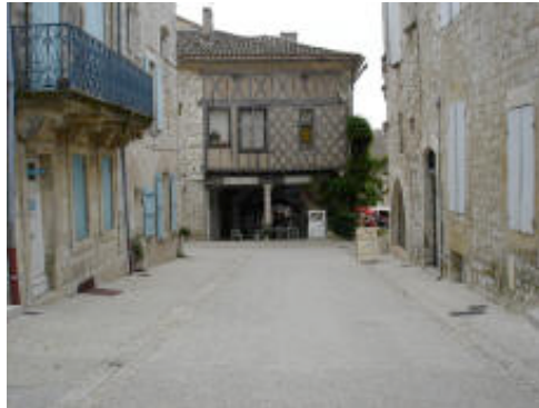
Bastide de Monflanquin