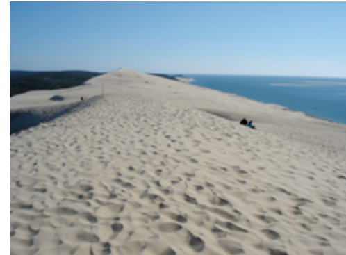
Düne bei Arcachon