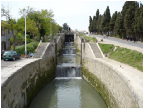
Canal du Midi