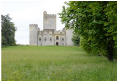
Château de Roquetaillade