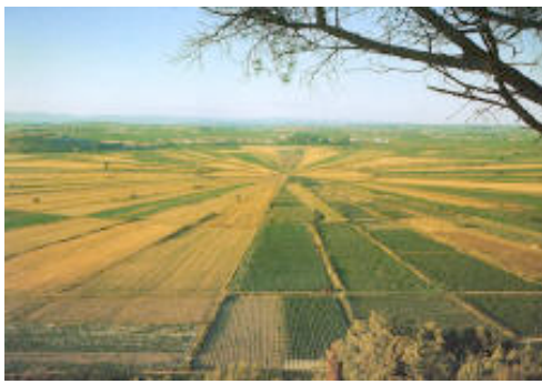
Les étangs de Montady - Oppidum d'Ensérune

Küsten Touristenorte als Resultat der Planung Candillis, Josic und Woods in den 70er-Jahren.