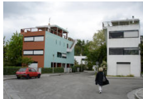
Pessac - Le Corbusier

Die Reise fand bei mildem Herbstwetter statt. Eine kleine Gruppe von 10 Personen bewegte sich von Montpellier westwärts über Sète, Narbonne, Carcassonne – mit einem Abstecher durchs Corbiere gebiet (mit Weindegustation während der dortigen Weinernte) - zur Katharenburg Peyreperthus. Weiter, dem „Canal du Midi“ entlang nach Toulouse, der (dank Airbus) Boomstadt dieses Teils von Frankreich. Weiter über einige englisch/französische „Bastides“ aus den 13/14. Jahrhundert in die Gegend von Bordeaux. Die Letzte Station war Arcachon mit seiner „Ville d’hiver“ am Atlantik.