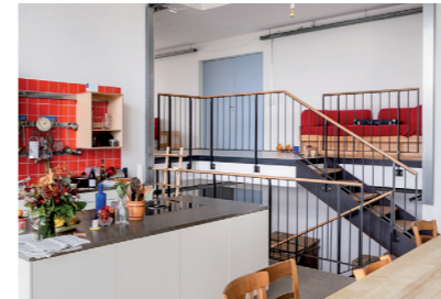
Wohnbaugenossen. Güterstrasse 8, BHSF Arch.