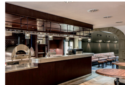
Frohsinn, 3B Architekten