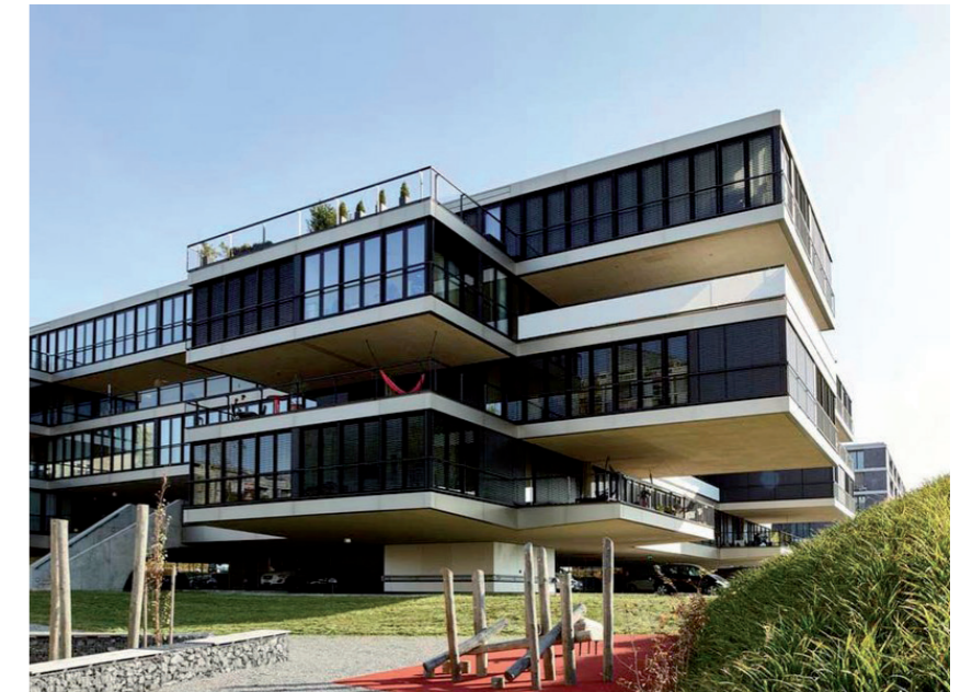
Wohnüberbauung Brünnen Bern, nord Architekten

Dieses Jahr treffen wir uns in Bern zu unserer Generalversammlung. Das Programm ist noch nicht endgültig ausgearbeitet. Im Bulletin 01/23 folgt die Ausschreibung.