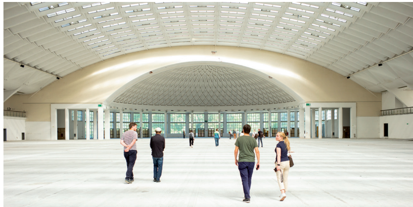
Palazzo Esposizioni, Pier Luigi Nervi