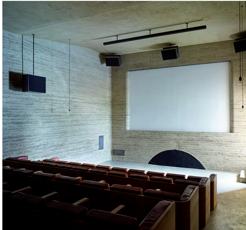
«Cinema Sit Platz», Architekten Capaul & Blumenthal Kunstmuseum Chur, Architekten Barozzi Veiga