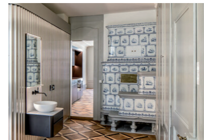
Kramgasse, 3B Architekten