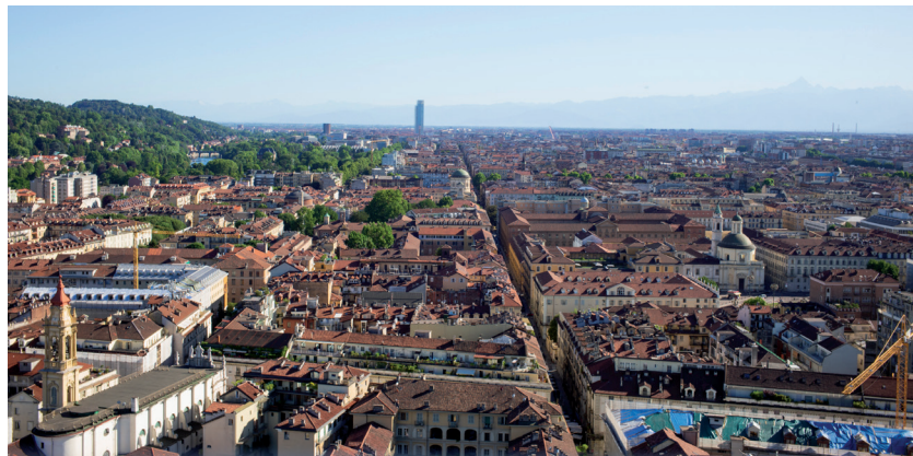
Turin die Hauptstadt der Region Piemonti

tesischen Ufers des Lago Maggiore, machen wir Halt am Monte Verità, der eine weitere Dimension der Reise bietet, indem wir einen ausgesprochen intimen Ort kennenlernen, der einst ein fast magischer Ort war, weil sich dort eine kleine Gemeinschaft von Intellektuellen aufhielt, die sich der Gesundheit, der Meditation und einer neuen Beziehung zwischen Leben und Natur verschrieben hatten. Von dieser Episode zeugen noch einige kürzlich restaurierte kleine Gebäude, ein Museum und das Hotel, das nach dem Diktat des Bauhauses gebaut und in den letzten Jahren von Livio Vacchini erweitert wurde. Um den Bahnhof Bellinzona zu erreichen, überqueren wir den Piano di Maga-