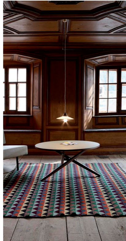
Türalihus, Architekten Capaul & Blumenthal