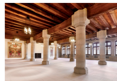
Rathaus, 3B Architekten