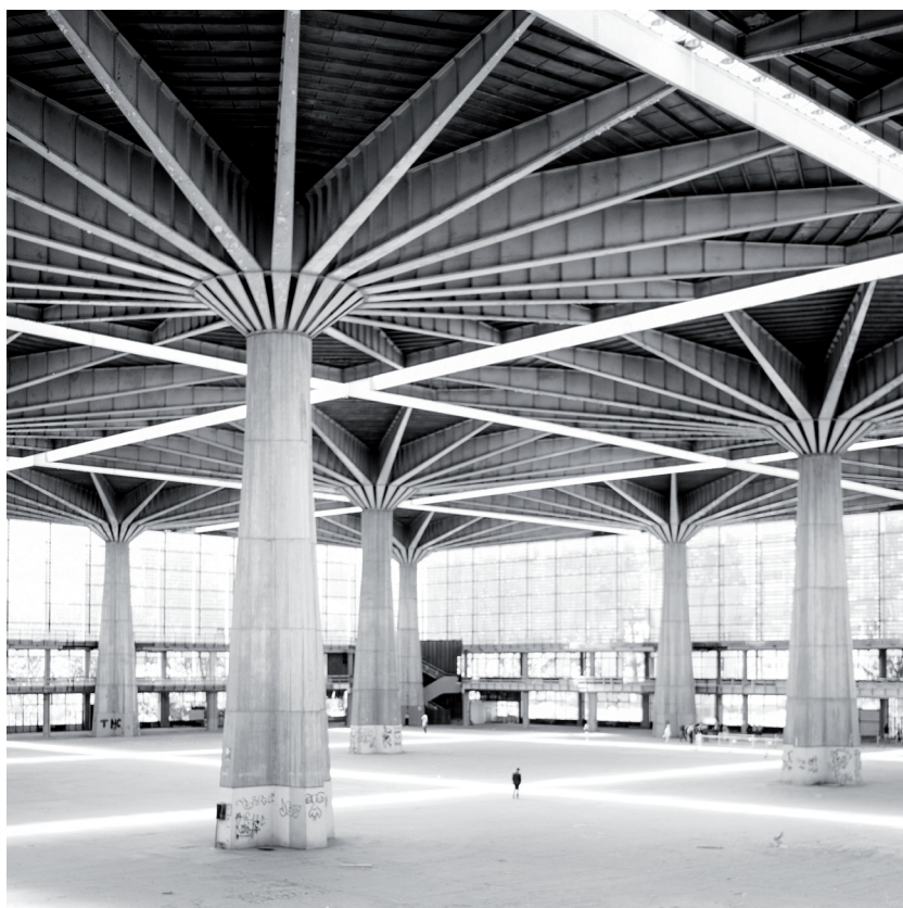
Reisen von a&k sind immer auch Happy Accidents, Palazzo del lavoro, Turin, Piere Luigi Nervi