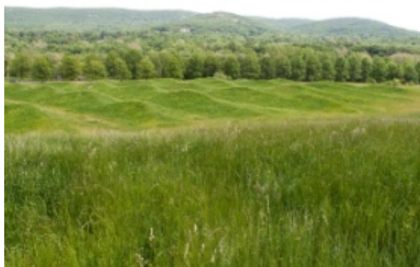
Storm King Park - Kuenstlerin Maya Lin