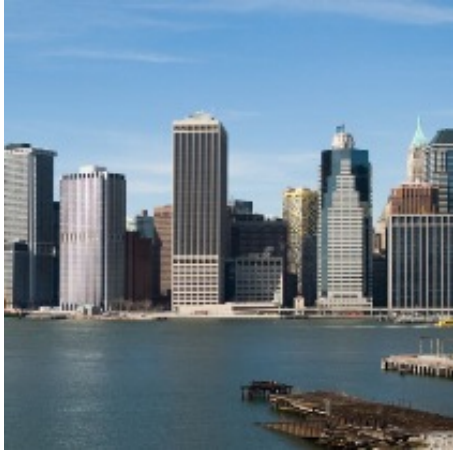
Blick von Brooklyn auf Manhattan

Im Mittelpunkt der Stadt und somit auch unserer Exkursion steht weiterhin der Bezirk Manhattan. Sowohl architektonisch als auch kulturell tritt Manhattan aus seinem Umfeld deutlich heraus. Hier stehen die bedeutendsten Bauwerke, werden die wertvollsten Kunstwerke ausgestellt und findet kulturell das vielschichtigste und anspruchsvollste Programm statt. Die Dichte an architektonisch bedeutenden Bauwerken ist kaum zu übertreffen, Chrysler Building, Empire State Building, Guggenheim Museum und Seagram Building sind nur ein kleiner Ausschnitt aus dem Portfolio Manhattans.