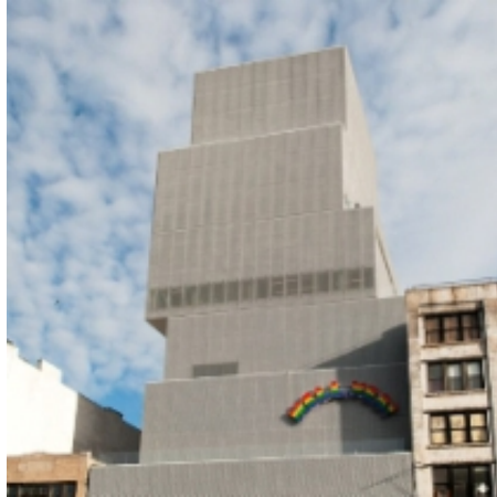
Lower East Side_ New Museum Arch. SANAA