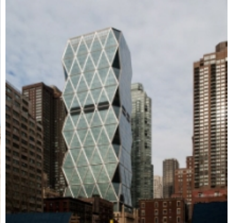
Midtown Hearst Gebäude Arch. Norman Foster

Das Programm (vorbehaltlich Änderungen) organisiert sich anhand der administrativen Bezirke Manhattans. Geplant sind weiters zwei Ausflüge, eine Fahrradtour nach Brooklyn und ein Tagesausflug nach Upstate New York mit Besuch der Dia Beacon Fondation und des Storm King Parks.